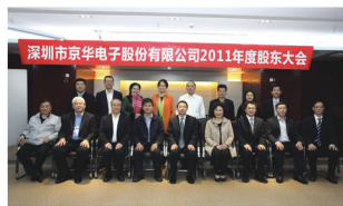
京华公司产生新一届董事会、监事会与经营班子成员合影。