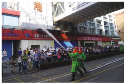
义务消防队员使用高射水枪灭火。