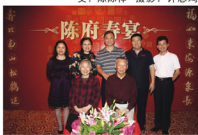
陈总夫妇与现任领导班子合影。